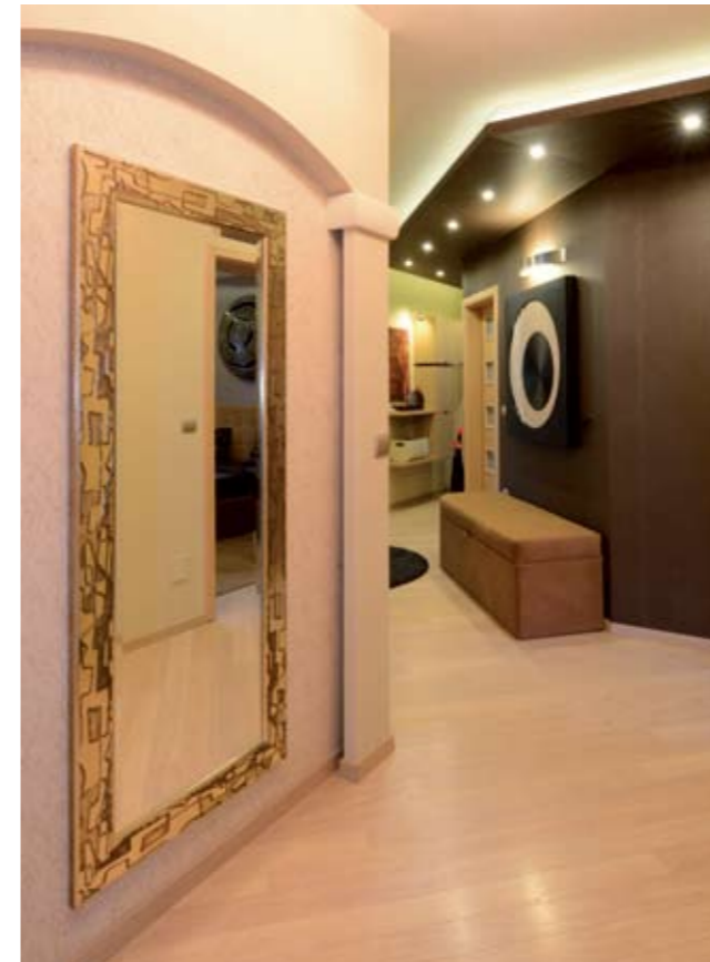
A folyosó a színek, a formák és a fények izgalmas találkozáshelye