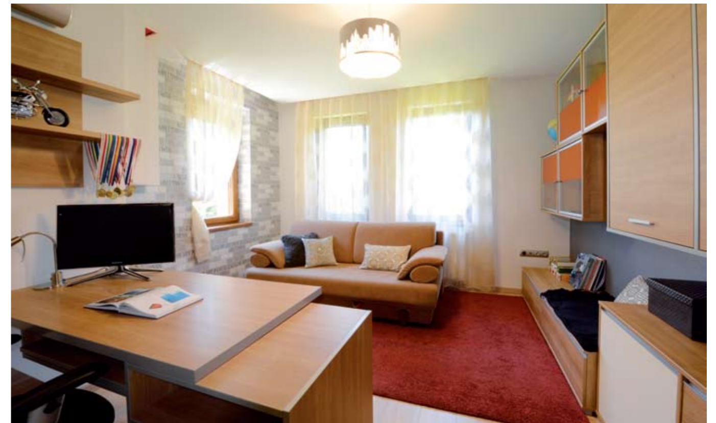
A gyerekszoba berendezésének már köze sincs a kisgyermekkorhoz: dolgozósarok, egy kényelmes, ágygá nyitható kanapé és modern vonalvezetésű tárolóbútorok kerültek ide