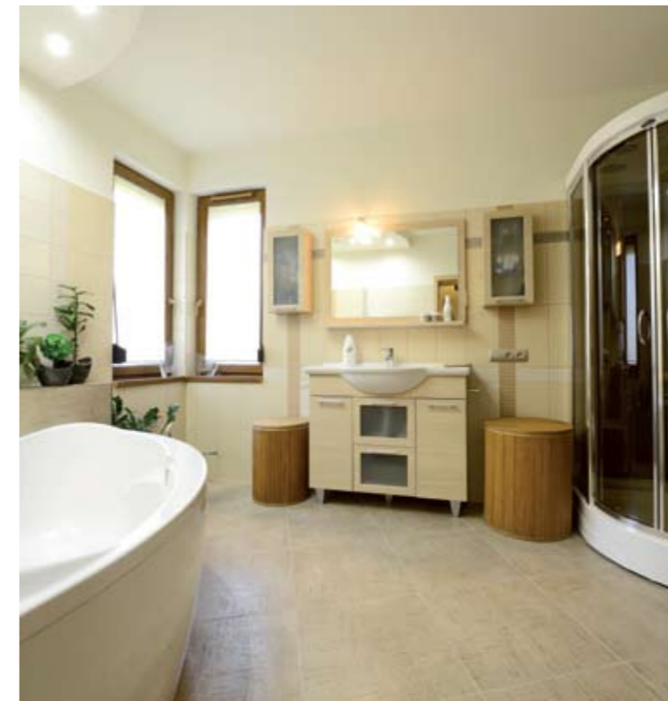
A világos burkolatok méginkább hangsúlyozzák a fürdőszoba tágasságát, ahol a kád mellett természetesen egy zuhanyfülke is helyet kapott