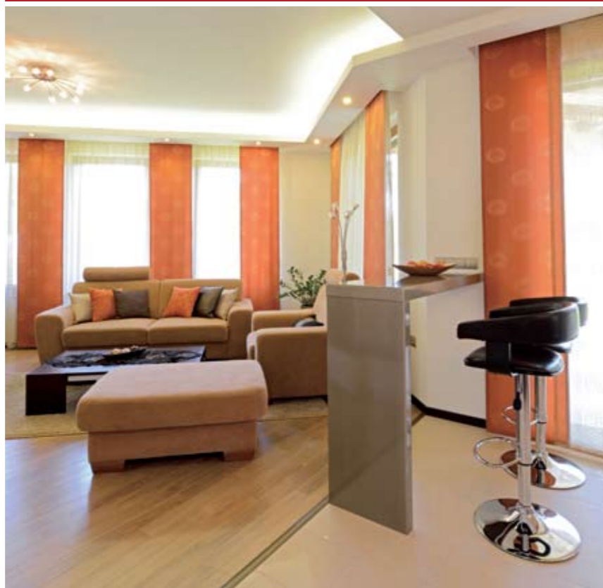
Az összenyitott, többfunkciós terek megkomponálásánál különösen fontos szerepe van a burkolatváltásoknak és az álmennyezeteknek