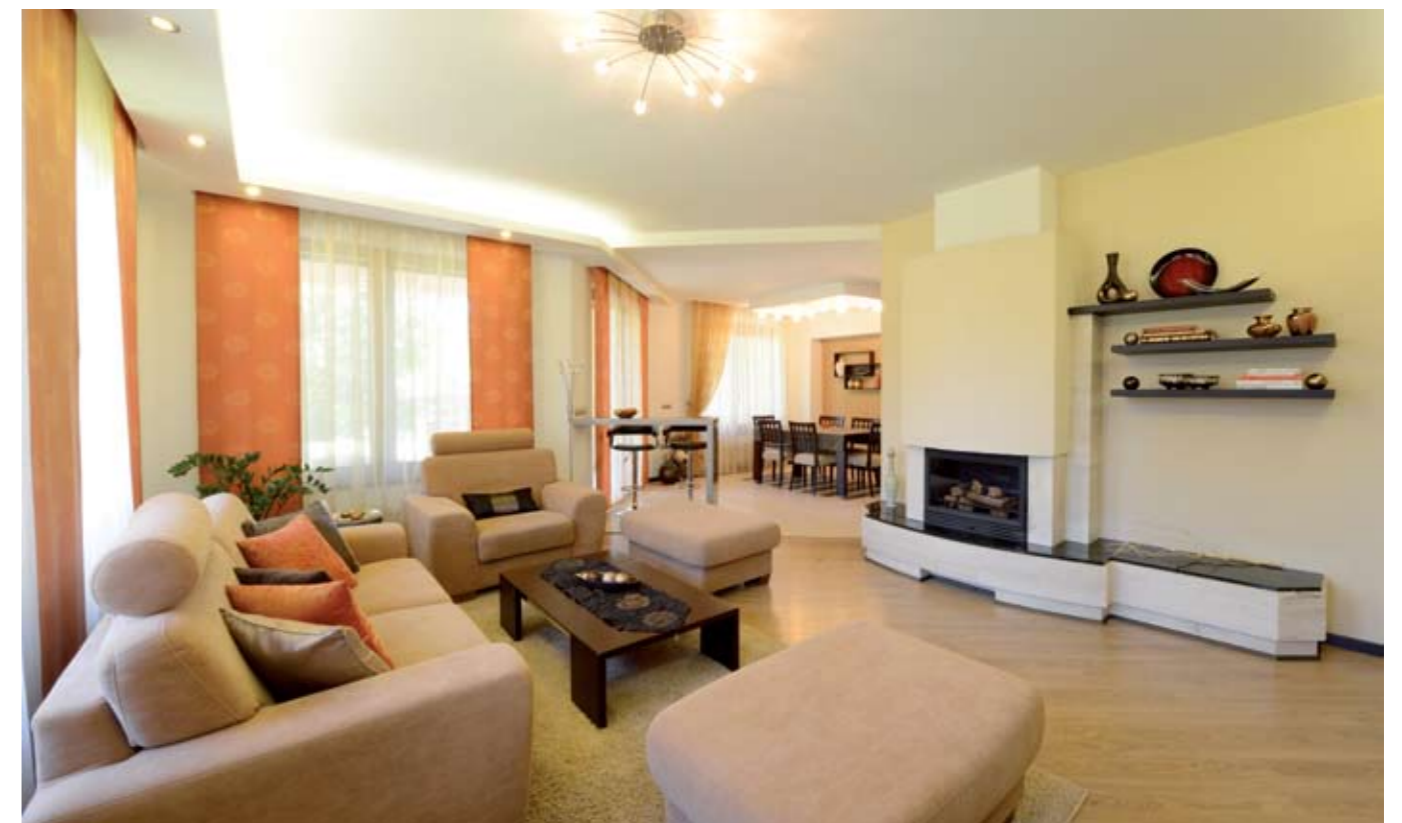
A kandalló tömege egyszerre tekintélyt parancsoló és könnyed

re. Amikor a finisbe érkeztek új házuk munkálatai, valóra is váltotta önmagának tett ígérését, és felkereste a lakberendezőt. Sajnos talán kicsit későn, hiszen már készen volt a gépészet, megvoltak a beltéri nyílászárók, így alkalmazkodni kellett a meglévő adottságokhoz. »