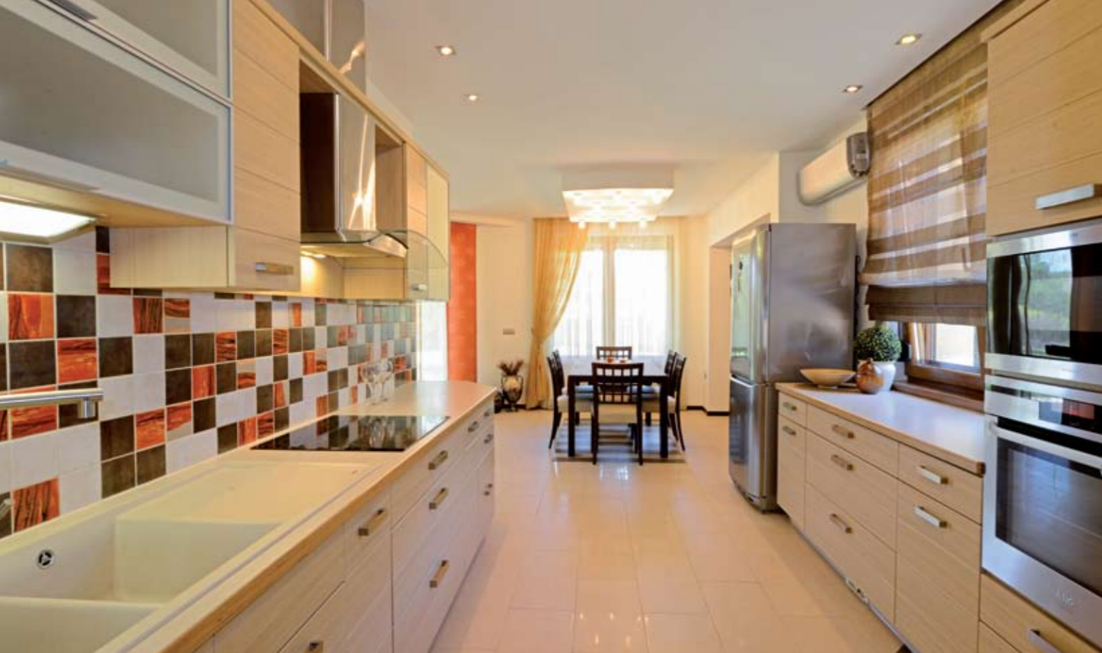
A konyhában a meszelt fülgy bútor könnyed, világos árnyalata mellett a falicsempén az egész lakás színvilágára jellemző csokoládébarna-narancs páros is megjelenik