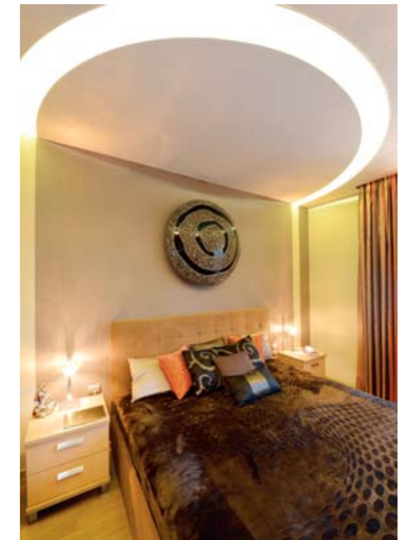
A szülői háló igazi különlegessége az ágy felett kialakított, világító álmennyezet